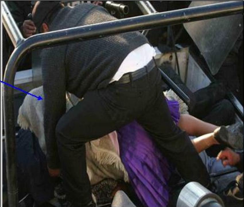
Imagen obtenida en el minuto 26:38 del DVD denominado "Romper el cerco" (anexo 3-29-5 de la Comisión Investigadora).

En esta imagen se puede apreciar la manera en que una mujer (por la vestimenta) es encimada junto con otras personas que ya se encuentran en la camioneta, así como la forma en que un elemento policial le cubre el rostro con su propia indumentaria (en este caso un chal o sarape).