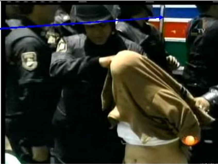
Imagen obtenida del minuto 04:26 del DVD denominado "Testimonio de lo ocurrido el 4 de mayo en San Salvador Atenco, Testimonios, *****" (anexo 1-3-12 de la Comisión Investigadora).

En esta imagen se puede apreciar como una mujer (bajada del camión que se alcanza a ver al fondo), es conducida al penal con el rostro completamente cubierto con su propia vestimenta.