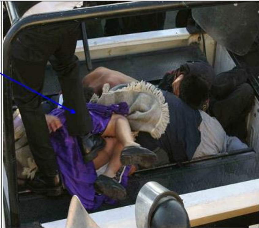
Imagen obtenida en el minuto 26:38 del DVD denominado "Romper el cerco" (anexo 3-29-5 de la Comisión Investigadora).

En esta imagen se puede advertir la manera en que esa misma mujer, es golpeada por un elemento policial quien le propina un puntapié aproximadamente en el tercio medio del muslo parte posterior.