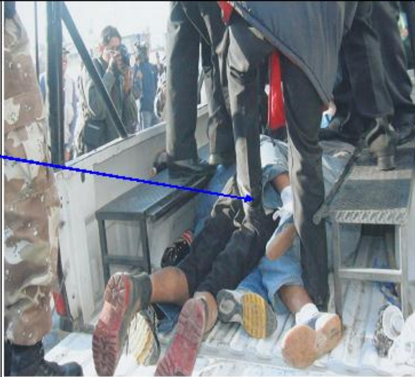
Fotografía del anexo 1-6-7 de la Comisión Investigadora.

En esta imagen fotográfica se puede apreciar la manera en que las personas eran encimadas durante su traslado en las camionetas, así como la forma en que son golpeadas con los pies por elementos policiales.