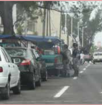
Personal de la SEMAR increpa a civiles en Veracruz

En Veracruz luego que se recrudeciera la violencia a consecuencia de la proliferación de grupos del crimen organizado, en diciembre de 2010, Felipe Calderón anunció el operativo denominado “Veracruz seguro”, el cual trató de la disolución de la policía intermunicipal y el ingreso de la Secretaría de Marina (Semar) a los municipios de Veracruz y Boca del Río.